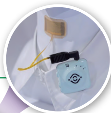
可穿戴智能人工喉

本届展会充分发挥了创新风向标与首发高地的作用，超过10,000种前沿产品技术的集中展示，引领了产业科技创新浪潮。