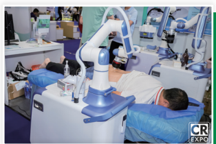
医疗器械/康复器械