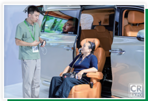
养老及无障碍设施