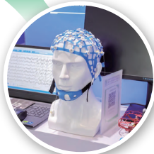
山东中科先进技术有限公司 NeuroSci无线脑电采集系统