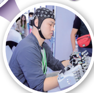
燕山大学脑机接口与智能康复团队 脑控协同康复机械手