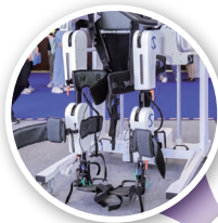
中国科学院自动化研究所 足下垂康复外骨骼机器人