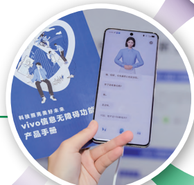
信息无障碍系列产品