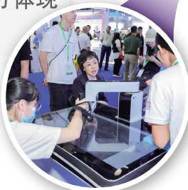
清华大学智能与生物机械实验室 脑机接口康复机器人

“创研汇”科技助残展区汇聚了清华大学、北京航空航天大学等多所高校与科研机构，展示了一系列代表国内最高水平的科技助残成果，充分体现了“产学研用”的深度融合。